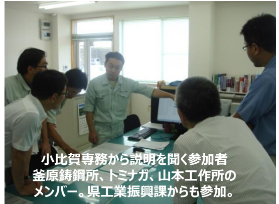
小比賀専務から説明を聞く参加者 釜原鋳鋼所、トミナガ、山本工作所のメンバー。県工業振興課からも参加。

できるところから始めよう！ まずは「手書きをデジタル化することから取組んでみよう」という声で締めくくりました。