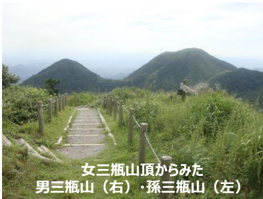
女三瓶山頂からみた 男三瓶山 (右)・孫三瓶山 (左)